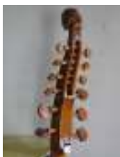
Violoncelle d'amour, à 5 cordes frottées et 7 cordes sympathiques