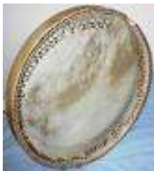
Daf iranien, percussion orientale