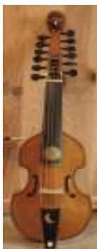
Quinton d'amour , instrument à cordes frottées, à 5 cordes boyau accordées en quinte et 7 cordes sympathiques