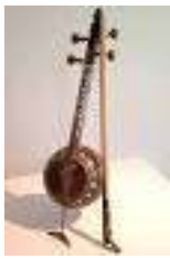
Kamancheh, instrument à cordes frottées

Instrumentos tocados por los músicos de CONCERT PERSAN