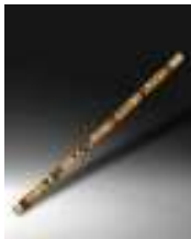
Ney, flûte orientale